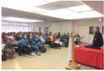
ボランティア連絡協議会