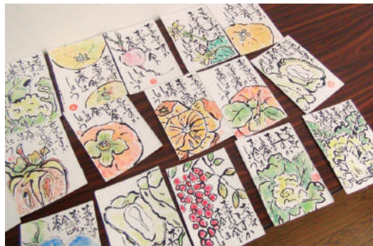
一人暮らしの高齢者等に絵手紙をお届け(和田区)

絵手紙に日々感じたことや季節のものを描き、地域の一人暮らしの高齢者などに届けている和田区の皆さん。地域の協力のもと公民館を使用し、この日は8人のメンバーが集まりました。絵の題材である花や野菜、果物は皆で持ち寄ります。