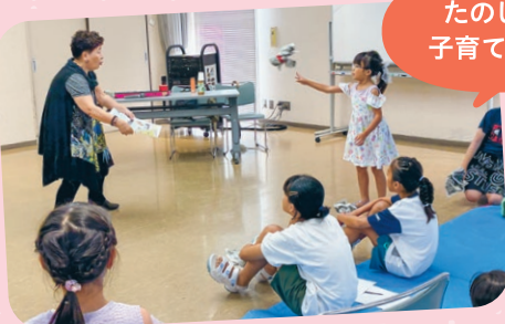
たのしい子育て講座