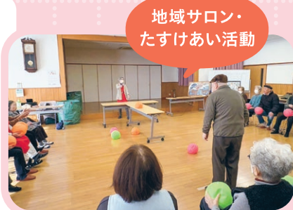
地域サロン・たすけあい活動