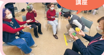
地域支えあい講座