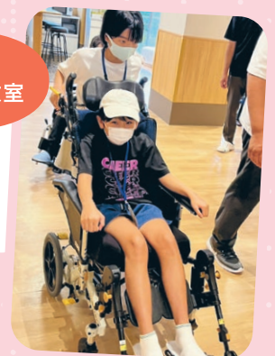
夏休み福祉体験教室